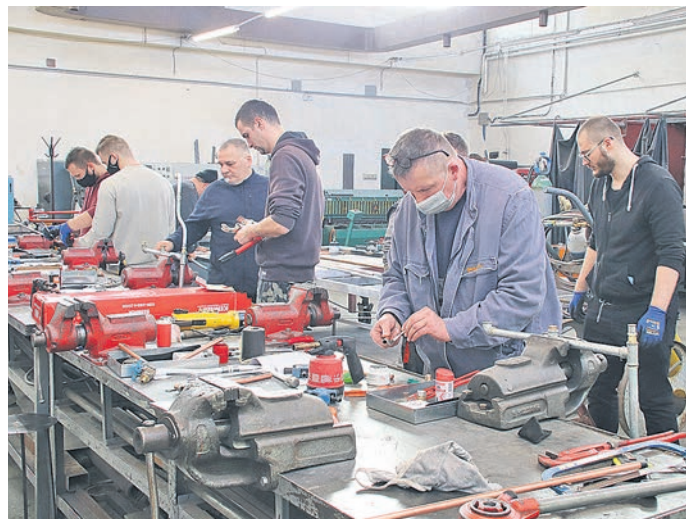
Felnőttképzés a kiskörösi Wattay középiskolában

Az eredmények azt mutatják, hogy 2021-ben a válaszadók bő kétharmada (69%) szembesült munkaerőhiánnyal visszavezethető nehézségekkel. A 20-49 fő közötti, illetve a kereskedelem területén működő vállalkozások kevésbé találkoztak ilyen jellegű problémákkal az elmúlt egy évben. A megkérdezett vállalkozások csaknem harmadának nem volt üres álláshelye 2022. január 1-jén, míg közel felüknél (45%) 1-10, míg negyedüknél (23%) pedig több mint 10 üres álláshely volt. A betöltetlen álláshelyek-