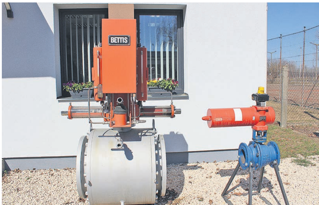
llyen, a gáztávvezetékekbe építhető biztonsági szakaszoló gömbcsapok működését felügyelik a cég dolgozói

A magyar cégek egy része helyi társaságokat alapított, hogy helyben végezze a gyártást. Ezt követően 2020-ra 2,1 milliárd