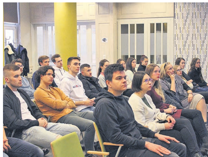
A kereskedelmi és iparkamara székházában tartottak előadást az egyetemistáknak

Az országban 23 területi kamara működik, melynek ernyőszerkezete az országos Magyar Kereskedelmi és Iparkamara. A területi szervezetek jogilag önálló szemé-